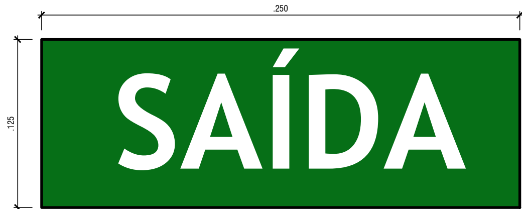
01 VISTA - PLACA E04 ESCALA 1/2